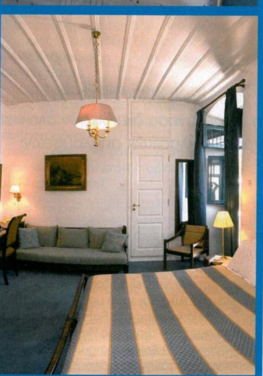
Ξενοδοχείο Orloff, Ύδρα βλέπε σελ. 66